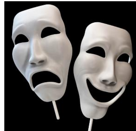
Die zwei Gesichter der Negaholiker.

Der dunkle Zwilling des Glückskekses ist der Pechkekse. Ein Gag in jedem Büro und ein Wink mit dem Zaunpfahl.